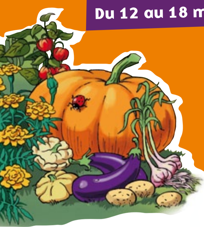
Tableau de bord de La semaine du jardinage pour les écoles 2012