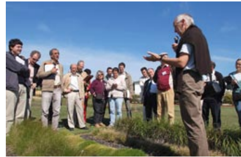
La diversité des espèces prairiales présentée aux enseignants