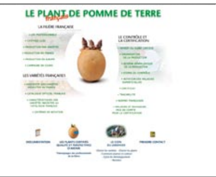
www.plantdepommedeterre.org s'est enrichi