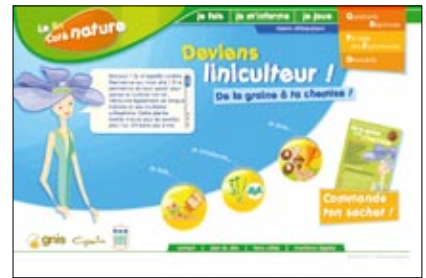
Un nouveau site pour tous : www.lelin-cotenature.fr