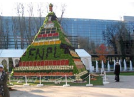
La biodiversité des légumes au congrès de la FNPL à Reims