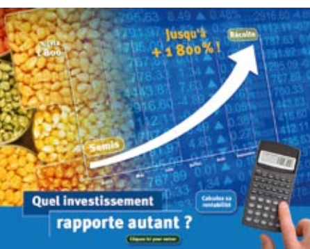
Argumentaire technico-économique pour les vendeurs, conseillers et agriculteurs