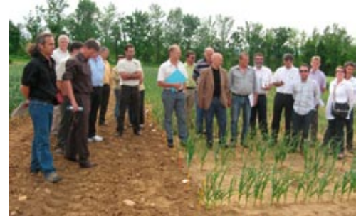
Les variétés d'ail pour petits emballages présentées aux reconditionneurs