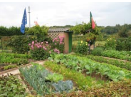
Prix du fleurissement des jardins familiaux collectifs remis par le Gnis à la ville de Crosne lors du concours national « Villes et villages fleuris »