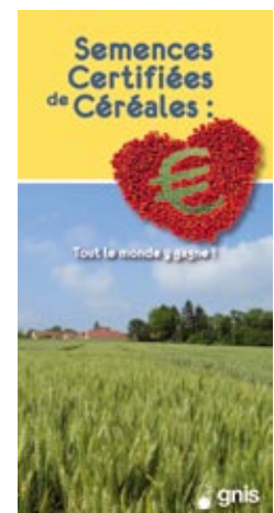
Brochure destinée aux céréaliers